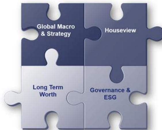
Abb. 2 „Investmentprozess“

Dem Anspruch, gerade auf dem Gebiet der Nachhaltigkeit zu den Marktführern zu gehören, dient auch ein seitens ASID initiiertes Tool, das sog. „Sustainable Energy Management Program“. Dieses Programm stellt in Verbindung mit dem bereits