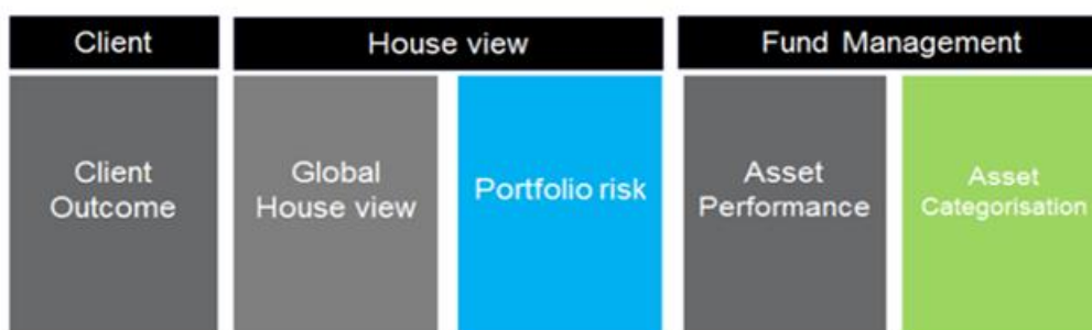
Abb. 3 „Ablauf des Investmentprozesses“

Anhand des von ASID im 1. Quartal 2016 aufgelegten Fonds „Aberdeen Standard German Urbanisation Property Fund“ lässt sich die Stringenz der Einhaltung der Nachhaltigkeits-Kriterien in alle drei Abschnitten der Planungs- (z.B. harmonisches Nebeneinander von Wohn- und Gewerbeimmobilien oder die Förderung von Familie und Beruf), Bau- (z.B. ordnungsgemäßen Sanierung des Grundbesitzes in Bezug auf das Grundwasser sowie die Verhinderung von sämtlichen Umweltlasten) sowie der Betriebsphase (z.B. Einhaltung der Vorgaben der Energie-Einsparverordnung (EnEV) bei Bereitstellung der Heizenergie sowie der Vorschriften des Erneuerbare-Wärme Gesetzes (EWärmeG)), sowohl in der Dokumentation sowie in der Praxis beispielhaft nachvollziehen.