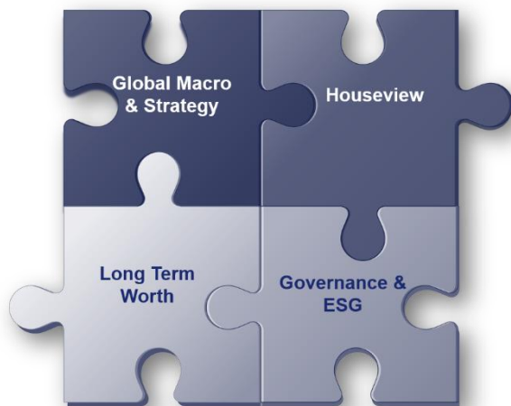
Abb. 2 „Investmentprozess“

insbesondere bei Firmen – nach mehr Transparenz gerecht werden. Zudem wird damit den Interessen der institutionellen Anleger Rechnung getragen, die immer öfter nach einem Beleg für die Wirksamkeit des Einflusses von ESG-Kriterien auf die Performance im Sinne einer Attributionsanalyse fragen.