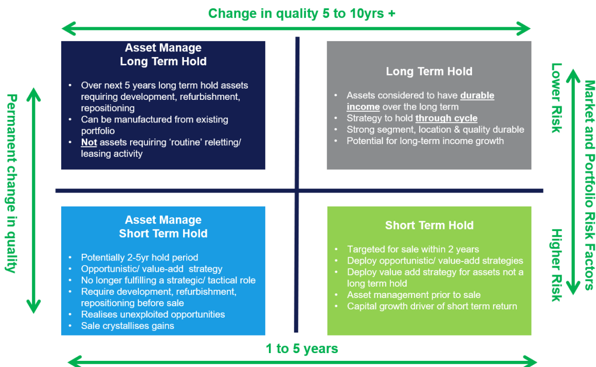
Abb. 4 „Kategorisierung der Assets“

Estate Structuring Team“ geführt. Die Änderung des Namens und der neue Titel für den Bereich machen deutlich, dass ASID dem höheren Beratungsanspruch institutioneller Anleger im Sinne komplexerer Lösungsansätze und entsprechender Angebote nachkommen und hier auch bewusst einen Akzent setzen wollte. Die Services der neu entstandenen Einheit umfassen folgerichtig auch das Beratungsangebot ganzheitlicher, steueroptimierter